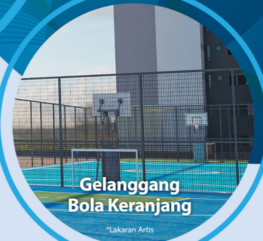
Gelanggang Bola Keranjang